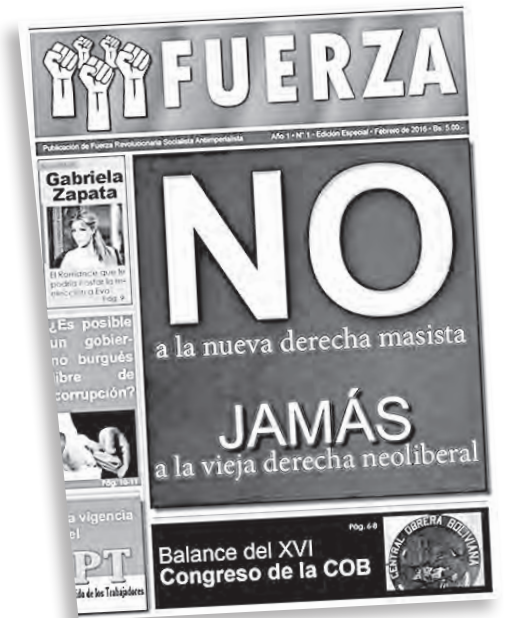
Periódicos de la izquierda revolucionaria, ARPT (UIT-CI) y Fuerza Revolucionaria Socialista Antiimperialista llamando a votar NO.