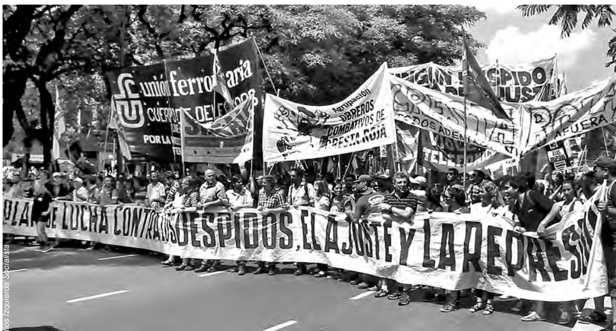
Cabecera de la columna del sindicalismo combativo cuyas organizaciones estaban preparando el encuentro del 5 de marzo en Racing, acompañando la marcha de ATE del pasado 24 de febrero.

Después de varias reuniones en los sindicatos de aceiteros de Capital, AGD-UBA y Ademys, salió una declaración común el pasado 11 de febrero con puntos programáticos acordados convocando al encuentro nacional para el 5. La convocatoria unitaria se anunció en una conferencia de prensa en el Bauén el 23 de febrero junto al apoyo al paro de ATE del 24 de febrero, donde se participó con una columna unitaria del sindicalismo combativo. Mientras todo eso ocurría, el día sábado 27, cuando lo único que quedaba era ultimar detalles, PO y PTS con ultimatismos y pretensiones de último momento rompieron la convocatoria al encuentro.