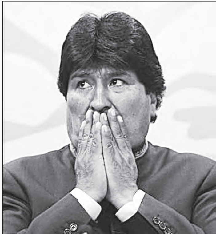
Evo Morales salió derrotado