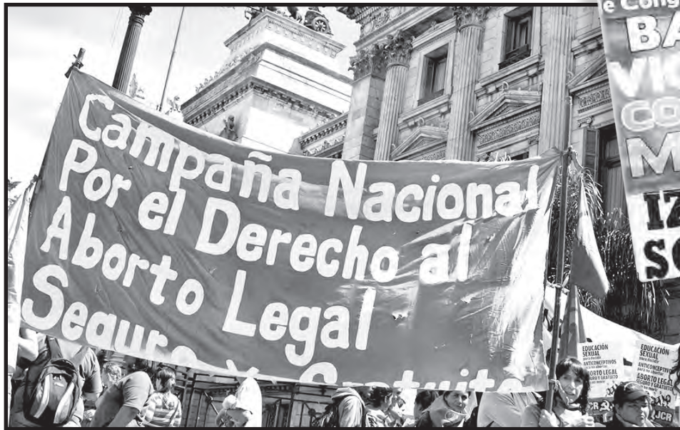
Marchemos todos el 8 de marzo

Este 8 de marzo nos encuentra a las mujeres frente a un nuevo escenario. Los pocos meses que lleva el gobierno de Macri y sus socios provinciales han demostrado una cosa: ellos también gobiernan contra los trabajadores y los derechos de las mujeres. A la rápida devaluación de los primeros días, se le ha sumado el tarifazo, el aumento de precios galopante, los despidos tanto en el sector privado como estatal y el intento de techo a las paritarias. Además, entre las primeras medidas de "recorte de gastos" del estado, los efectos fueron en detrimento de la situación de las mujeres: desmantelamiento y cierre de programas de las áreas de mujeres a nivel nacional y de las provincias, cierre de refugios para atención a las víctimas de las violencias de género y desabastecimiento de medicamentos. Esto, en nuestro caso, repercute en falta de métodos anticonceptivos, significando que en pocos meses habrá aumento de embarazos no deseados y de en-